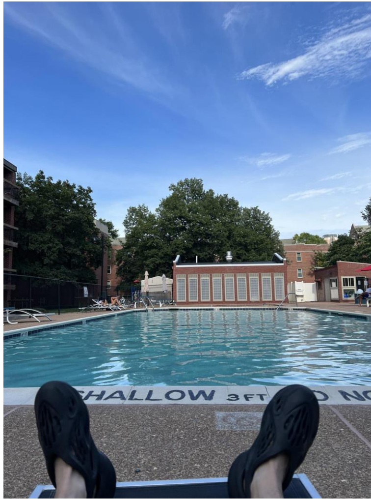
(宿舍區裡面的露天泳池)

此外，校方每周都會安排至少一次活動，內容非常豐富充實，包含打高爾夫、看大聯盟職棒、打保齡球、看音樂劇、參觀啤酒廠與當地知名地標等，所有聖路易當地有名的旅遊行程都帶我們去一遍，而且每次都是校方包車，並且含一頓預算很高的大餐。如此無微不至的照顧，讓我們幾乎沒花到什麼自己的薪水，可以全部存下來或是另外拿去旅遊。