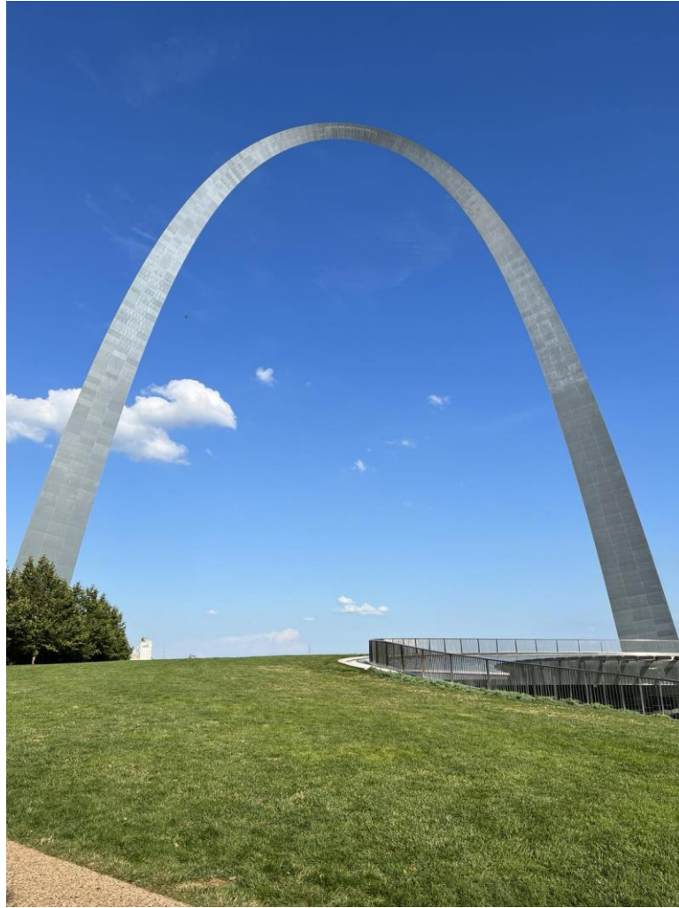
(參訪景點之一：聖路易知名地標--大拱門)