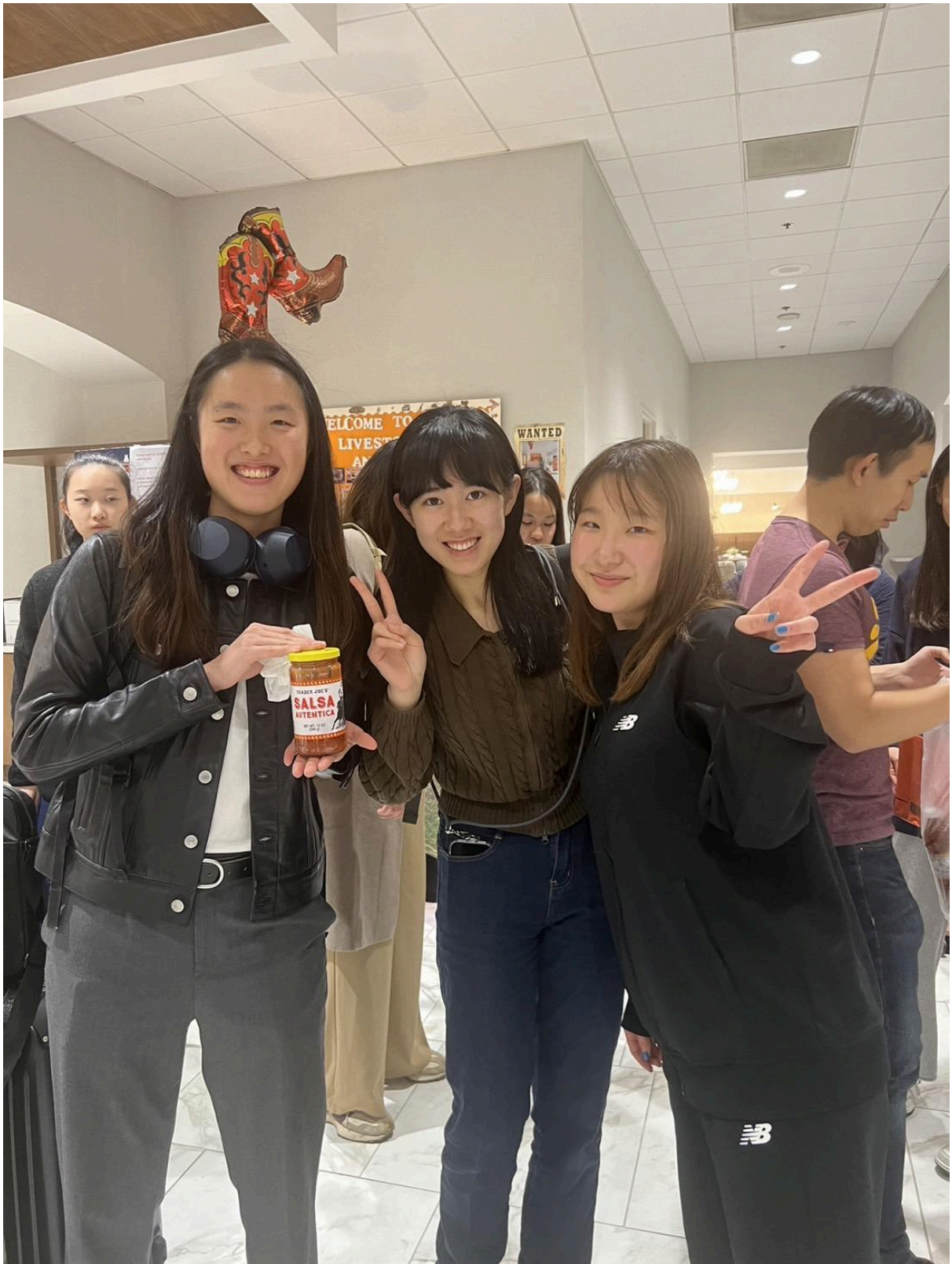
Me and my roommates.