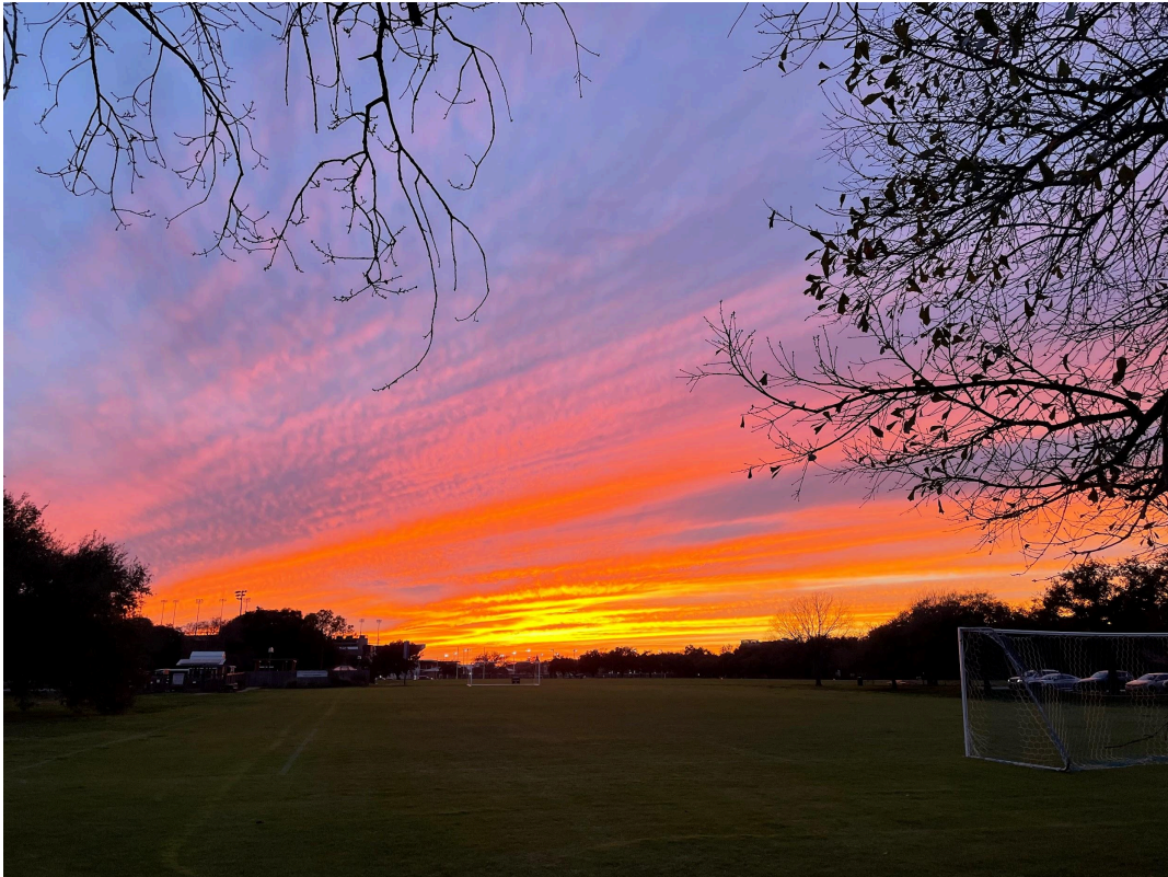
Stunning sunset on Rice campus