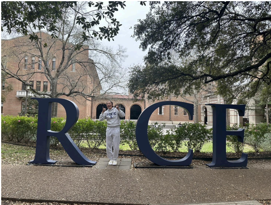
校園裡很可愛的拍照景點